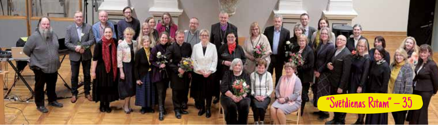
"Svētdienas Rīts" – 35