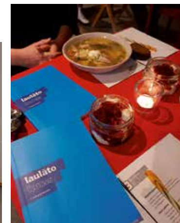
Zupa, deserts, Laulāto kursa pieraksti un laulātais draugs pie tā paša galda – un vakars ir izdevies!

Lai katrs pāris patur par Laulāto kursu vislabākās atmiņas un ar Dievpalīgu ienes no visa dzirdētā savām attiecībām visnoderīgākās lietas savā ikdienā! ●