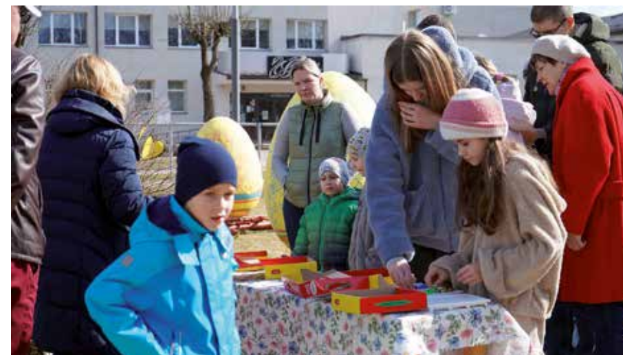
"Lielo jautājumu ceļojums" bērniem un vecākiem dod iespēju uzzināt, ka Lieldienas nav tikai stāsts par zaķiem un Ziemsvētki – par dāvanām.