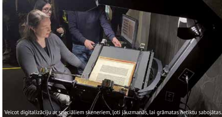
Veicot digitalizāciju ar speciāliem skeneriem, ļoti jāuzmanās, lai grāmatas netiktu sabojātas.