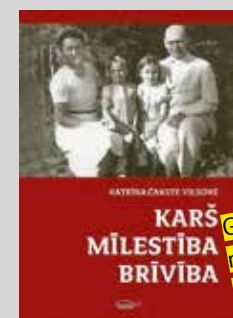
Grāmata būs nopērkama IHTIS veikalā. Cena EUR 10.00

L atvijas neatkarības atjaunošanas svētku laikā, no 2. līdz 9. maijam, Latvijā viesosies pirmā Latvijas Valsts prezidenta Jāņa Čakstes mazmeita un Konstantīna Čakstes meita Katrīna Čakste-Vilsons, lai piedalītos savas atmiņu grāmatas "Karš, mīlestība, brīvība" atvēršanas svētkos. Ievadvārdus grāmatai rakstījusi Katrīnas Čakstes-Vilsones meita Anastasija, kas apmeklēs Latviju kopā ar māti.