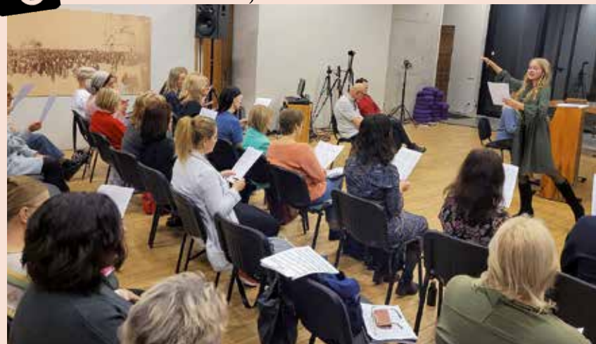
Rīgas Lutera draudzes koris mēģinājumā: "Mums šovakar Mocarts un Aleksandra Spicberga = #superpozitivmēģinājums."