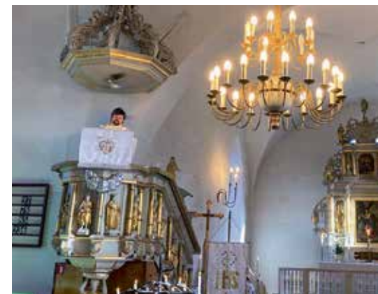
Trīsdesmit pieci gadi mācītājam pagājuši Kuldīgas Sv. Katrīnas baznīcas kancelē.

To mēs arī esam pieredzējuši šajos kalpošanas 35 gados. Jūs zināt, ka Dievam nav bezdarbnieku, – ja tu vienā vietā vairs nekalpo, tad Dievs atver citas durvis, kur kalpot. Es vēl nezinu – kur, bet klusa doma ir. Piemēram, Alsungas Kristus draudzē. Mums bija draudze Alsungā, bet tās darbība