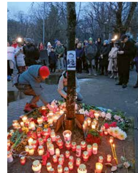
16. februārī Rīgā, pretim Krievijas vēstniecībai, pie Alekseja Navaļņija Dzīvības koka.

Krievijas vēsture nu ir cita. Tajā ir kāds ļoti nopietns Balsts, kas nu visu mainīs. Ir Sākums jaunam virzienam. Šī Balsta, jaunās ēkas pamatu vārds ir Aleksejs Navaļņijs. Šīs ēkas celtniecību vairs nevarēs apturēt. Un tā ir arī priecīgā ziņa visam mūsu reģionam, arī visām apspiestajām tautām pagaidu tautu cietumā Krievijā. Tomēr, lai jaunā ēka tiktu veiksmīgi būvēta, mums savā rīcībā, nodomos un motīvos arī būs jāsalīdzinās ar šo Cilvēku. Tāda nu ir šo tuvojošos Liel dienu vēsts. Tik daudz kas no krustaceļa un krustā sišanas jau ir piepildījies, bet arī Augšamcēlšanās notikums nenovēršami sekos. Tikpat nenovēršami kā visas norises dabā. Cilvēks – pat ne Krievijā nav no tām atrauts. Patiesības augšamcēlšanās ir sākusies – Krievijā, Ukrainā