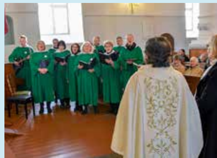
Draudzes liturģiskais ansamblis savam mācītājam bija sagatavojis īpašu dziesmotu veltījumu.