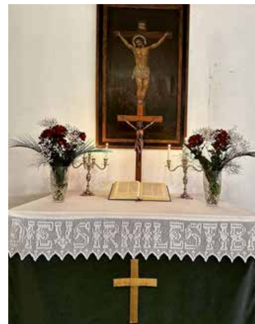
Blīdenes jaunais altāris.