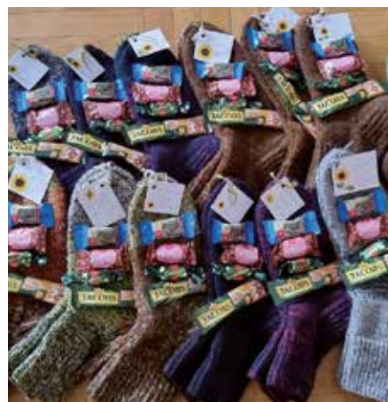
Sagatavots sūtījums Ukrainai.